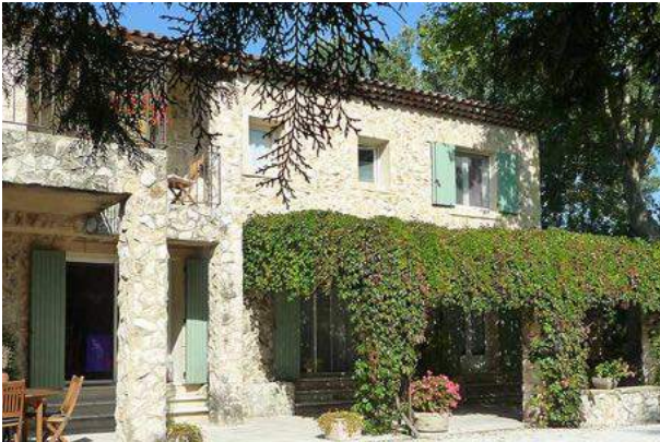
Das Haus auf der Insel Barthelasse