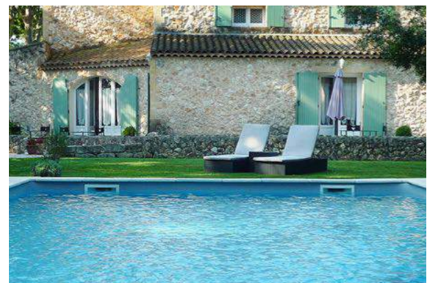
Zimmerbeispiel und Ihre Gastgeber im Luberon